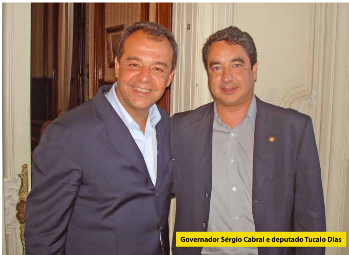
Governador Sérgio Cabral e deputado Tucalo Dias

to prazo ficou prometida a instalação de uma UPA em Inoã entre março e abril de 2010 para desafogar o Conde Modesto Leal e permitir a recuperação do hospital. Verba de 7 milhões de Programa de Apoio ao Desenvolvimento dos Municípios (Padem) em convênio com a prefeitura de Maricá já está comprometida sendo que o Estado vai entrar com 95% dos recursos. Será o começo da recuperação de alguns logradouros da cidade com asfalto de boa qualidade. Água para Ponta Negra, Inoã e Itaipuaçu é compromisso do governador com o povo de Maricá por meio de mandato do deputado Tucalo. As obras de melhorias e recapeamento da estrada Maricá/Itaboraí foi, segundo Sergio Cabral, pleito antigo do nosso representante na Alerj. Novas viaturas para a PM que atende Maricá e ambulâncias foram lembradas como esforços do deputado junto ao governo em benefício da população. Vem aí uma uni-