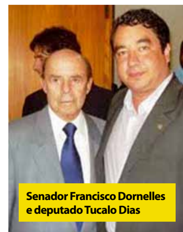
Senador Francisco Dornelles e deputado Tucalo Dias